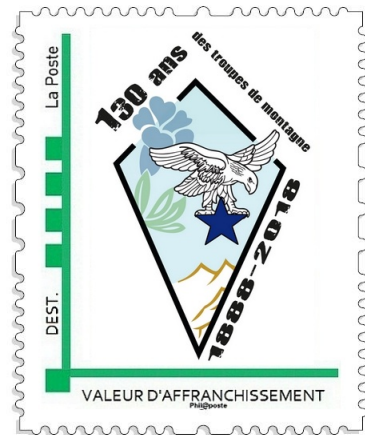
Timbre MTAM Lettre verte France < 20g (visuel non contractuel)