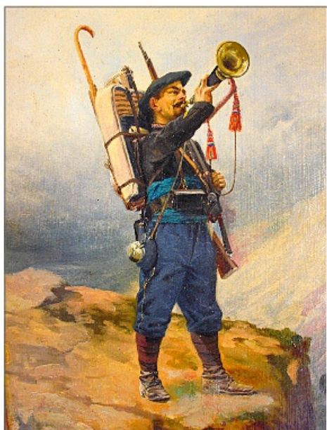
130 ans des Troupes de Montagne 15 juin 2018