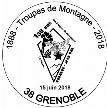
Timbre à date spécial pour l'oblitération des timbres sur les souvenirs (visuel non contractuel)