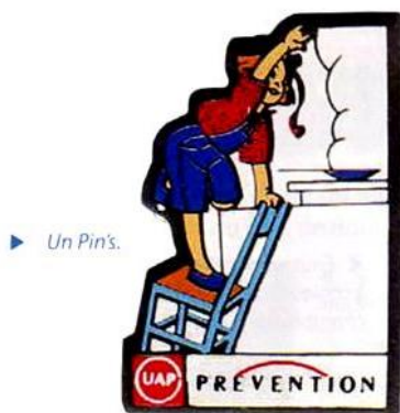
► Un Pin's.

Afin de présenter notre recherche, chacun fait comme il le sent bien sûr ! Mais il apparaît nécessaire de structurer cette présentation : raconter une histoire est le moyen le plus simple d'atteindre cet objectif.