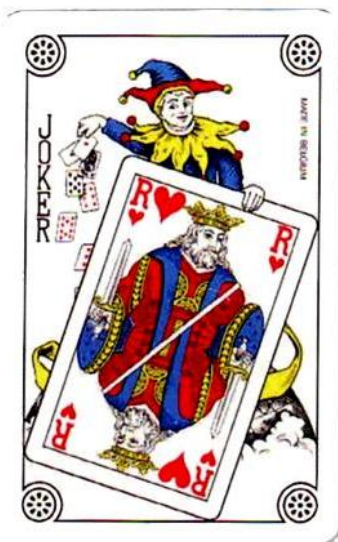
► Carte à jouer.

Ce type de présentation regroupant du matériel philatélique et non philatélique représente une ouverture par rapport aux collections classiques. L'appellation « CLASSE OUVERTE » est maintenant utilisée.