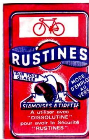
► Rustines pour les chambres à air de vélo.

Dans une présentation destinée à la compétition « style championnat » la participation comprendra au moins 50 % de matériel philatélique. Pour le matériel non philatélique une seule condition, pouvoir être inclus dans les cadres d'exposition (il est recommandé de ne pas dépasser les 5 mm d'épaisseur).